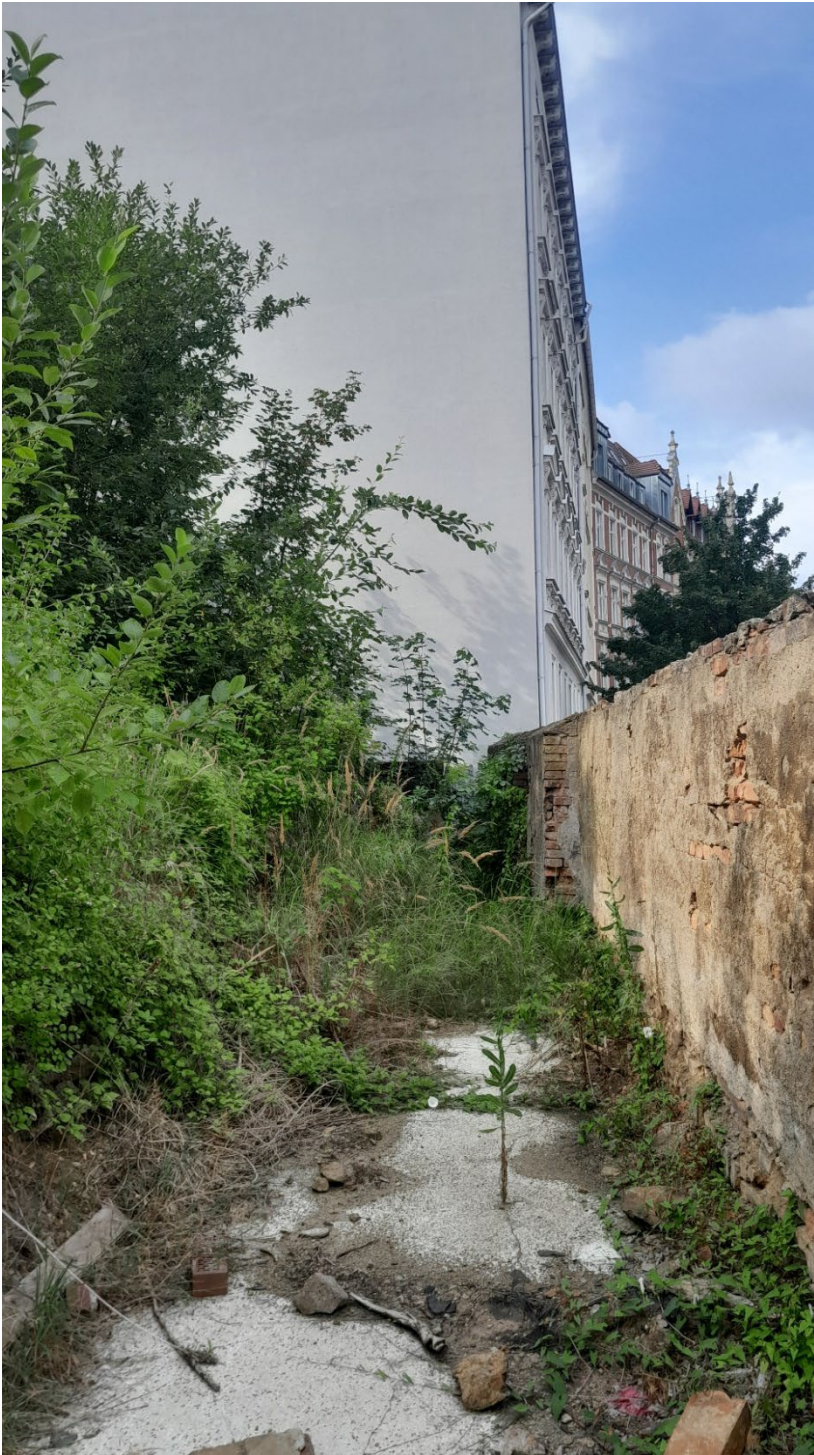
Fläche hinter der Ziegelmauer

KOMMWOHNEN Görlitz GmbH Konsulstraße 65, 02826 Görlitz