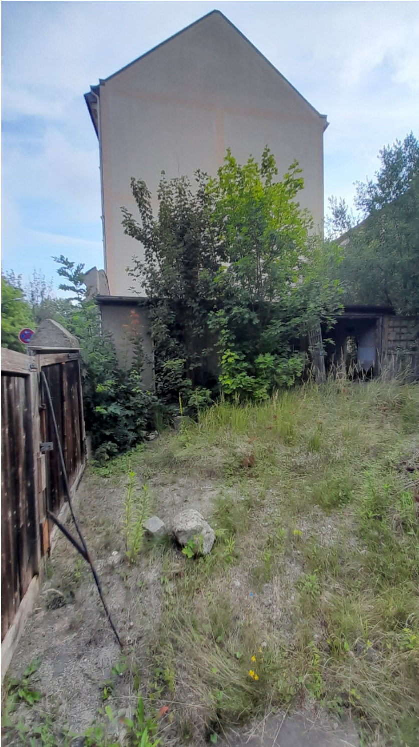
Fläche hinter dem Einfahrtstor

KOMMWOHNEN Görlitz GmbH Konsulstraße 65, 02826 Görlitz